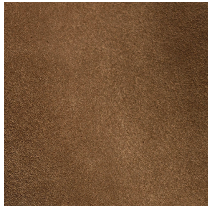
100% LE - pelle / leather

La pelle scamosciata, detta anche Suede , si caratterizza per la realizzazione ed il trattamento. Molto apprezzata per la sua morbidezza, eleganza e versatilità.