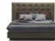
FRIDA Ennio Arosio pag. 10