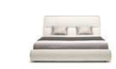
COSY design Mauro Lipparini

L 2110 x P 2300 x H 1050 - L 1930 x P 2020 _ W 83 1/8" x D 90 4/8" x H 41 5/16" - W 76" x D 79 4/8"