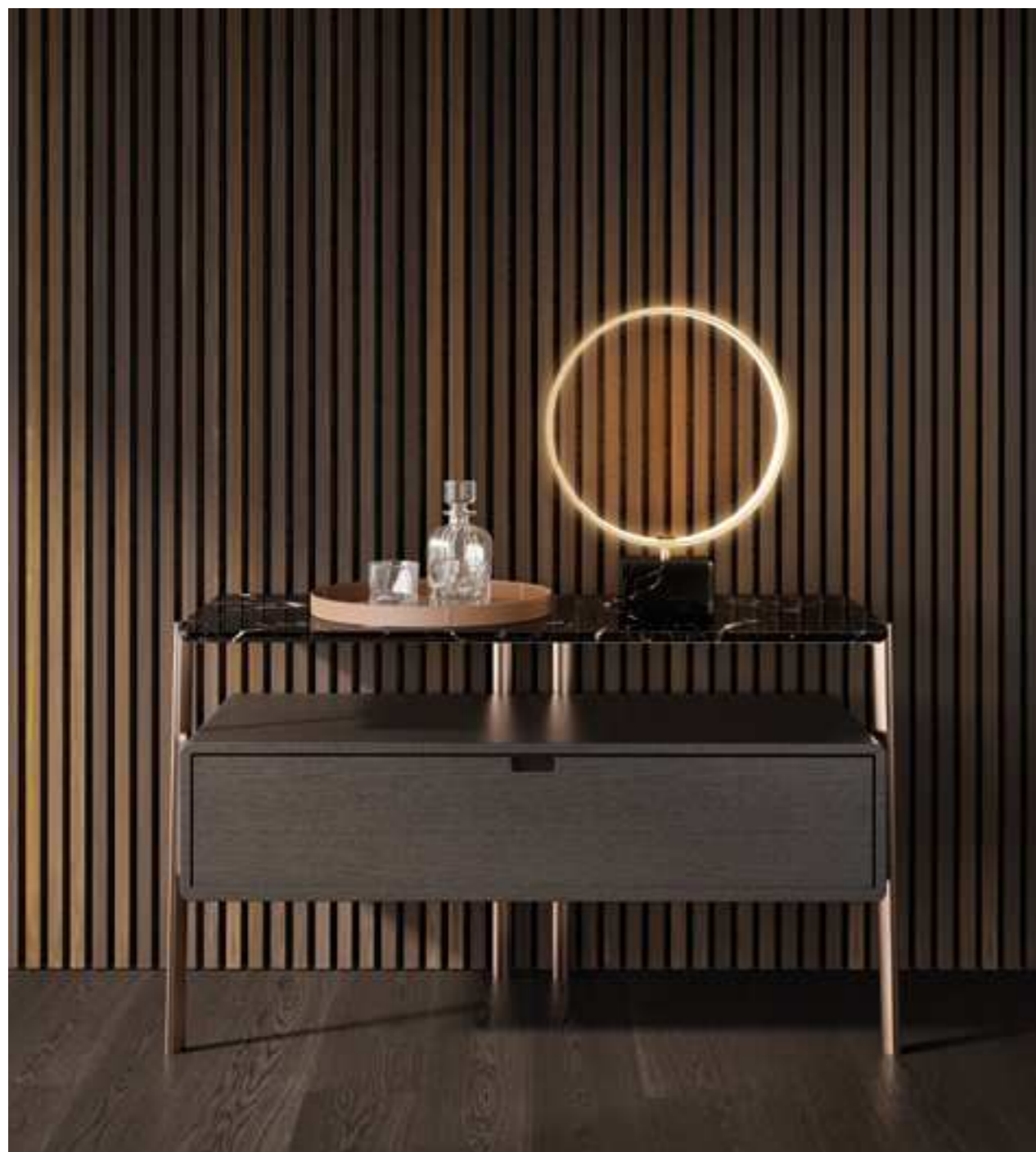
In questa pagina e nella precedente: Comò Eros con struttura di diametro ovale metallico verniciata bronzo, piano in marmo marquinia e contenitore in rovere tinto nero.