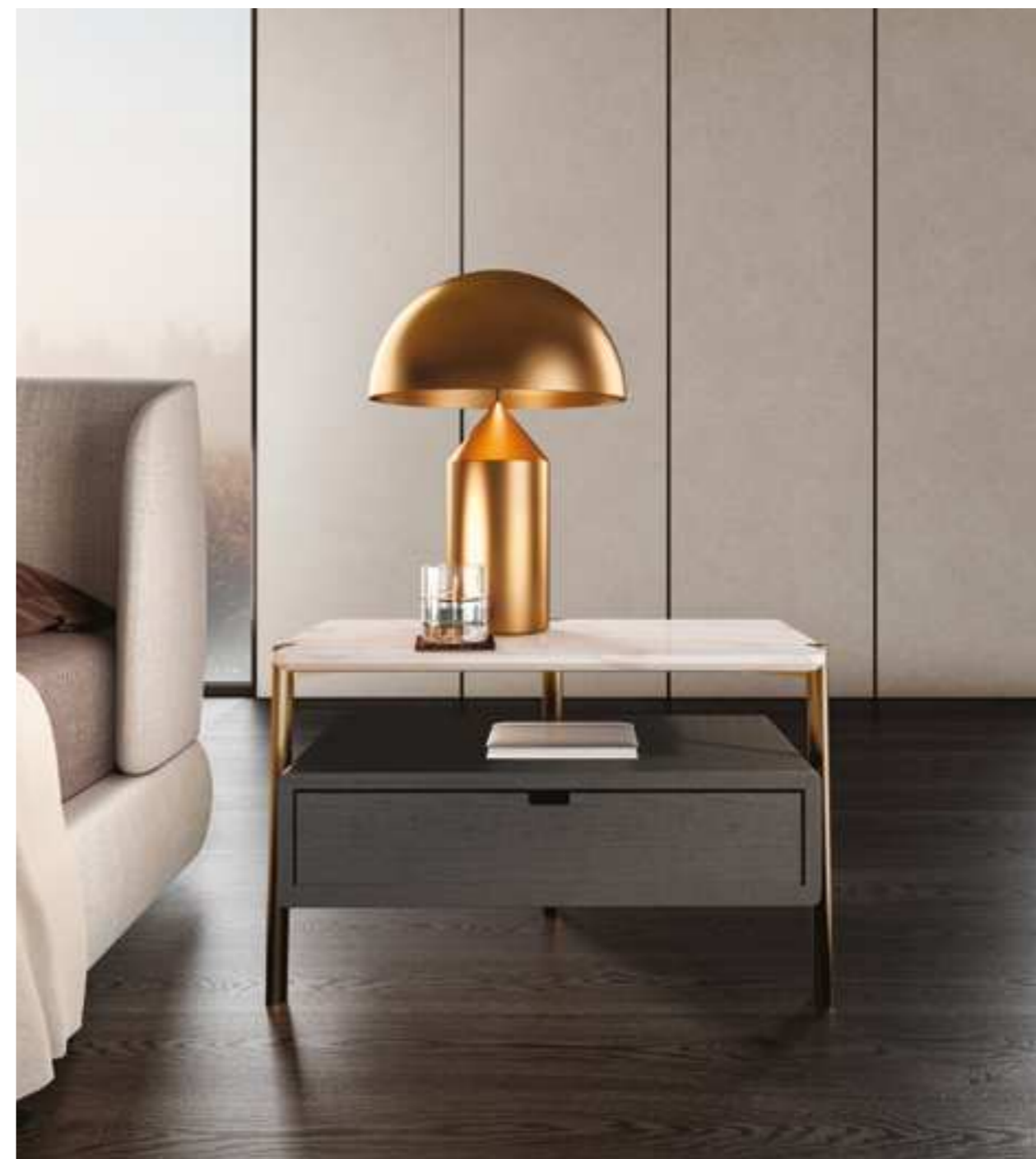
In questa pagina: letto Virgin rivestito in tessuto. Comodino Eros con struttura di diametro ovale metallico verniciata bronzo, piano in marmo calacatta oro e contenitore in rovere tinto nero.