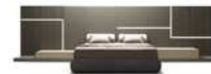
GHIROLETTO Mauro Lipparini pag. 34