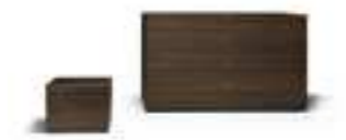
TAO NIGHT Mauro Lipparini pag. 104