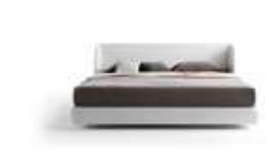
VIRGIN design Mauro Lipparini

Letto dall'elegante forma scultorea, essenziale e accogliente, espressione della vocazione sartoriale di MisuraEmme, in grado di coniugare morbidezza e razionalità. Profili architettonici esaltano i volumi imbottiti e conferiscono al contempo un leggero segno grafico. Disponibile con o senza cassone, nelle dimensioni 1.600 / 1.800 cm. Si contraddistingue per la testata avvolgente, disponibile in tessuto, pelle.