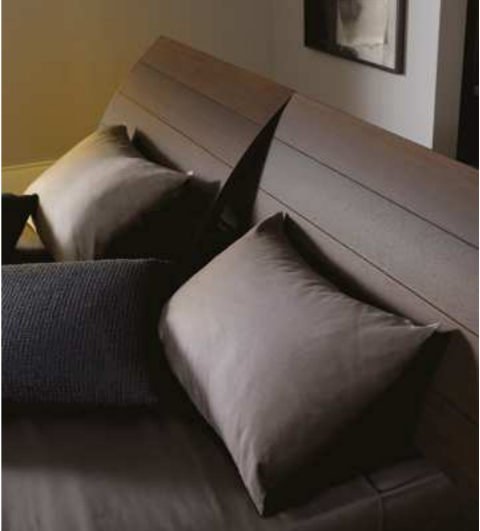
Nelle pagine precedenti: letto Giorgia con rete piana strutturale, finitura essenza. Tavolino Hill con base in massello laccato lucido e piano in marmo travertino. Sedia Cleò con base in massello e seduta rivestita in pelle. A sinistra: comodino Cube con piano in vetro verniciato. Sopra: dettaglio della testata del letto Giorgia reclinabile in 5 posizioni.