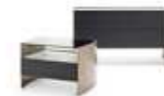
MILVIAN NIGHT Francesco Lucchese pag. 100