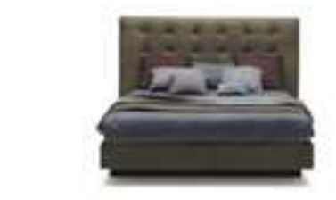
FRIDA design Ennio Arosio

L 2080 x P 2280 x H 906 - L 1800 x P 2000 / W 81 7/8" x D 89 6/8" x H 35 5/8" - W 70 7/8" x D 78 6/8"