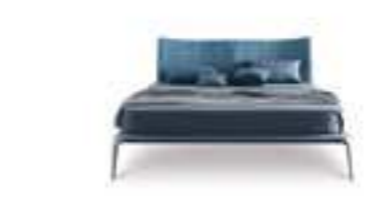
MARGARETH design C. Marelli & M. Molteni

Giroletto e testata con rivestimento in tessuto, ecopelle, pelle e cuoio. Struttura del letto in metallo decappato termosaldato con tamponi in poliuretano espanso. Giroletto in faggio massello con piedi sagomati in massello rovere. Nel rivestimento della testata in tessuto, ecopelle e pelle è previsto un bordo a contrasto in tinta con la struttura.